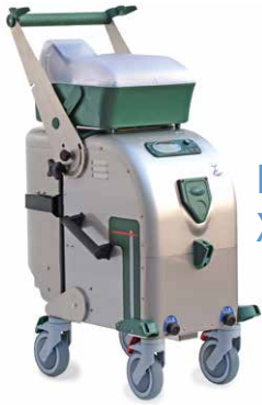
BlueEvolution XL+ Edelstahl