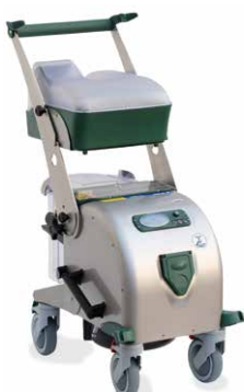
BlueEvolution S+ Edelstahl

Der BlueEvolution S steht seinem großen Bruder in der Leistung kaum nach, punktet aber mit einem Plus an Wendigkeit. Aufgrund seiner reduzierten Grössenmasse trumps der Blue Evolution S immer dann gross auf, wenn's eng wird.